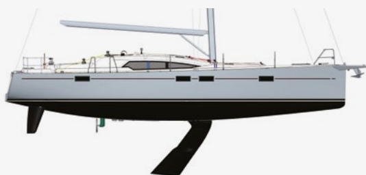
QUILLE RELEVABLE LIFTING KEEL